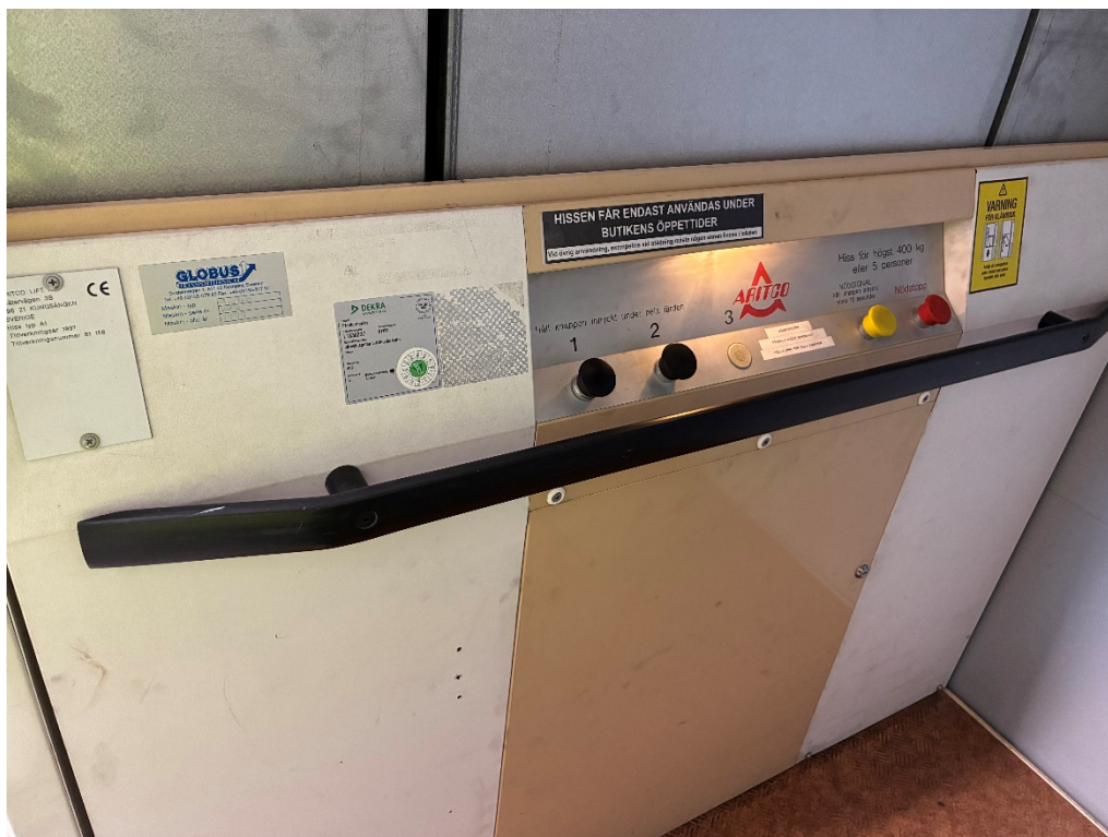
Figur 2. Plattformhissen innifrån