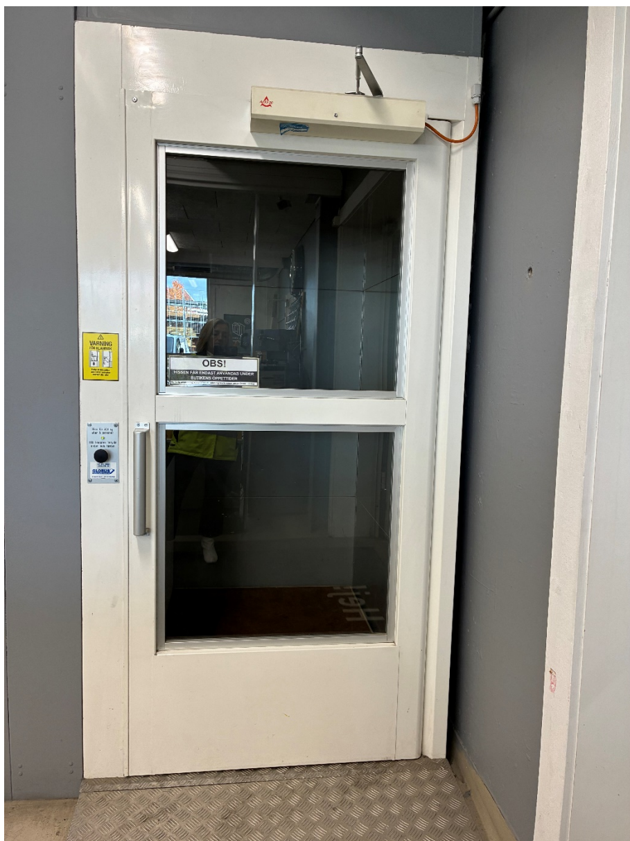
Figur 1. Information saknas som att hissen inte får användas.